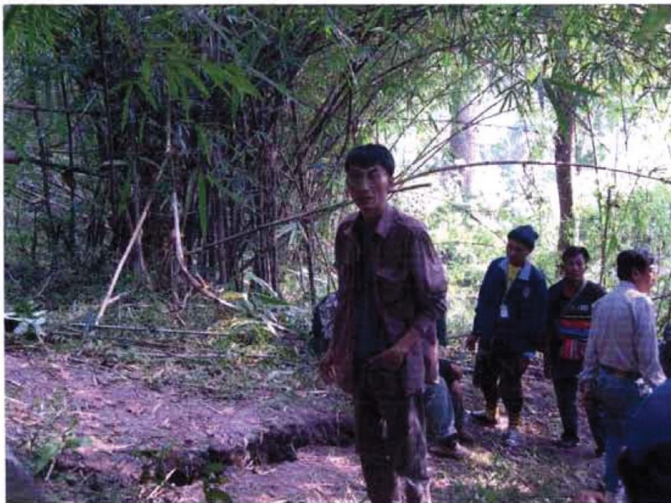
รูปที่ 2 แสดงสภาพพื้นที่ที่เกิดดินทรุดตัว เป็นที่ลาดเอียงเทไปทางทิศตะวันตกเฉียงใต้ (จากซ้ายไปขวาของรูป)