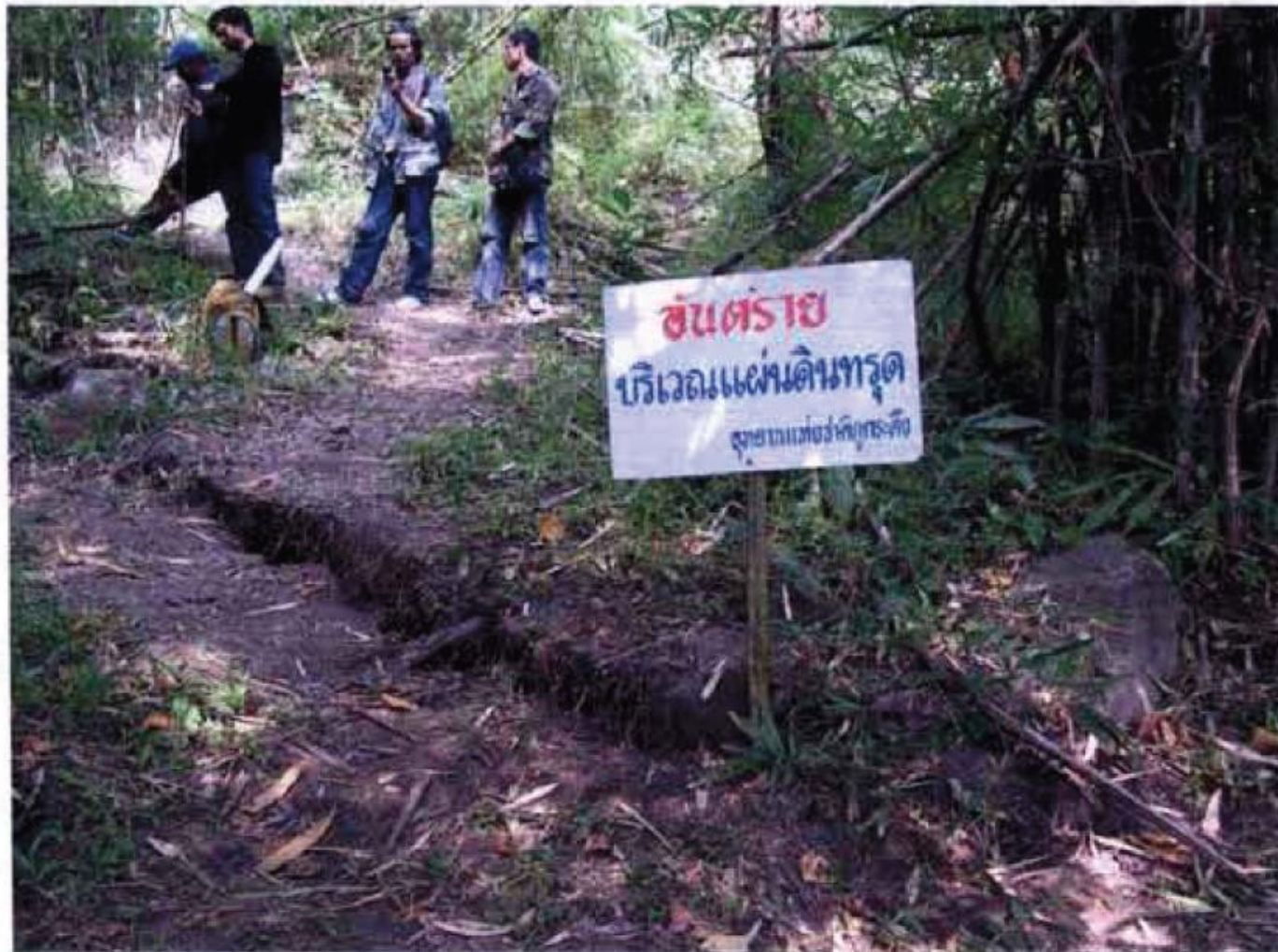
รูปที่ 3 แสดงที่ลาดเนินเขาที่ต่อเนื่องมาจากทางด้านบน (ทิศตะวันออกเฉียงเหนือ)